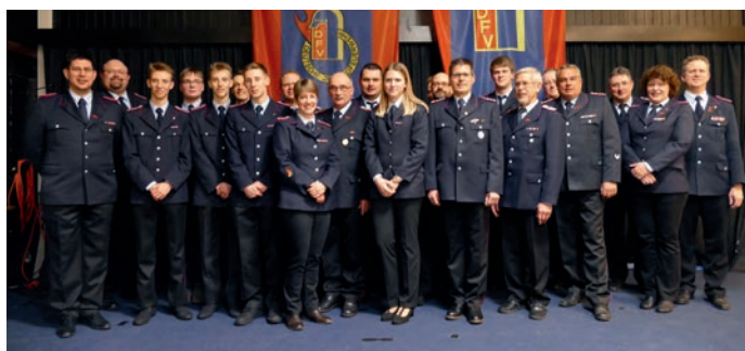
Gruppenfoto der Feuerwehr Scharnebeck

47 Einsätze wurden im letzten Jahr abgearbeitet. Diese teilen sich in 13 Brand, 30 Hilfeleistungen und 4 sonstige Einsätze auf.