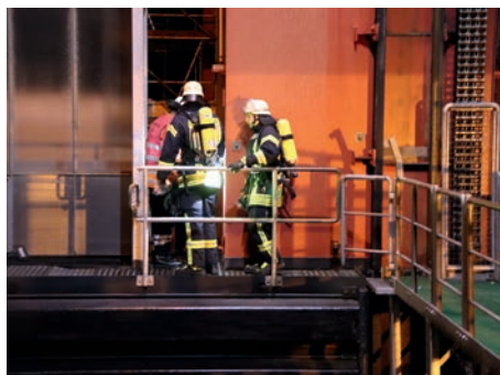
Fehlalarm am Schiffshebewerk Scharnebeck

Am Abend des 22.01.2019 verunfallte ein Fahrer mit seinem Audi A3 auf der B 209 zwischen Brietlingen und Lüdershausen. Ein zufällig vorbeifahrender Notarzt leistete erste medizinische Hilfe. Die Feuerwehren aus Brietlingen, Lüdershausen, Artlenburg und Scharnebeck wurden daraufhin auf die Bundesstraße alarmiert und retteten den Fahrer aus seiner misslichen Lage.