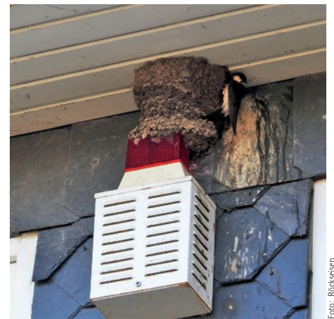
Eines von 15 Mehlschwalbennestern am Inselsee-Gebäude