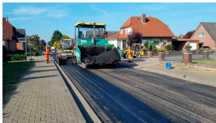
Die Dorfstraße erhielt eine neue Verschleißschicht