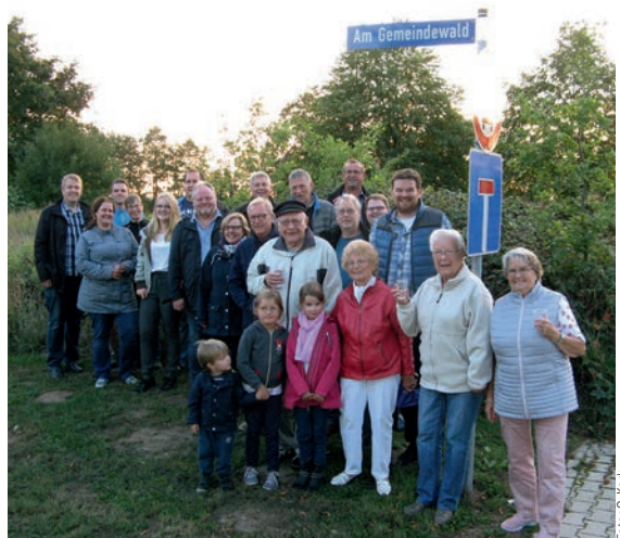
Anwohner und Nutzer des Weges mit dem neuen Schild

Trotz einiger dunkler Wolken am Himmel fanden sich einweihungslustige Anwohner und regelmäßige Benutzer des Waldweges am Neubaugebiet Rethscheuer-West zur Enthüllung des neuen Namens „Am Gemeindegewald“ ein. Es war bisher ein namenloser Weg. Der Gemeinderat hatte aufgerufen, Vorschläge einzureichen und der Vorschlag von Andreas Köhlbrandt fand eine Mehrheit. Tatsächlich handelt es sich bei dem Wald um gemeindeeigene Flächen. Der Weg soll eine gangbare, sichere und jetzt auch beleuchtete Alternative zum Adolf-Lüchau-Weg für Fußgänger und Radfahrer darstellen. Die Beleuchtung ist aufgrund der Naturnähe sparsam ausgelegt, aber es war den Ratsmitgliedern wichtig,