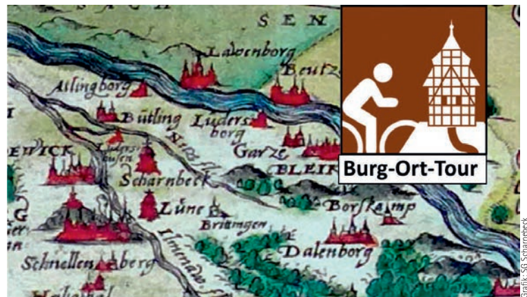
Graphik: SG Scharnebeck

Wer also Lust hat, sich vom Fahrradsattel aus in die mittelalterliche Elbtalaue entführen zu lassen, der sollte sich am 27.10.2018 am Eingang der Kirche zu Echem einfinden. Dieser Ort ist gleichermaßen der Endpunkt der etwa 35 Km langen Rundtour, die gegen 17:00 Uhr