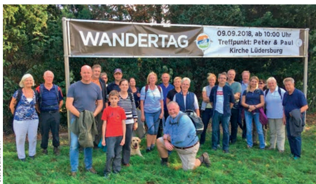
Teilnehmer des Wandertags in Lüdersburg

verlegen und die Schaltkästen zu setzen. Die anderen Ortsteile sollen im Ausbau zeitnah folgen und die Hausanschlüsse werden im Anschluss dann sukzessive gelegt. Falls Sie als Eigentümer noch keinen Antrag auf einen Anschluss gestellt haben, so können Sie auf der Homepage der Gemeinde Lüdersburg die hierzu nötigen Kontakte einsehen.