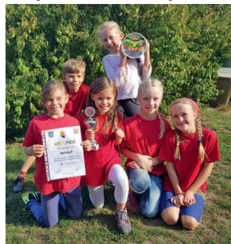
Die Rullstorfer Feuerwehrkinder freuen sich riesig über den 3. Platz beim O-Marsch

Als nächstes ging es dann zwei Wochen später zum Kreisfeuerwehrtag nach Stapel bei leider nur noch 12 Grad, Regen, Gewitter und Hagel. Auch hier wurde ein „Spiel ohne Grenzen“ organisiert. Stifte versenken, Sandsack werfen oder Tennisball in Dosen transportieren waren nur einige der tollen Stationen. Hier platzierten wir uns im Mittelfeld. Zum 10-jährigen Jubiläum der Kinderfeuerwehr Kirchgellersen wurde dort ein O-Marsch von knapp vier Kilometern angeboten, dort wurden wir am Ende mit dem 3. Platz belohnt. Erste Hilfe und viel Geschick wurde den Kindern abverlangt. Größte Herausforderung waren hier