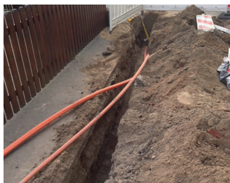
Der Glasfaserausbau geht voran