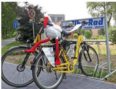
Der neue Fahrradparkplatz an der T-I

Der Fahrradständer ist dankenswerter Weise von der Firmer Elba-Rad aus Adendorf gesponsert worden.