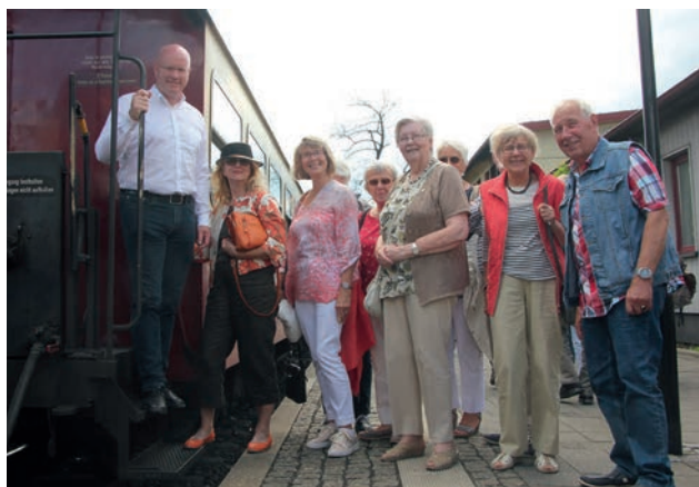
Die Fahrt mit der Harzquerbahn war ein besonderes Ereignis

[ Kerstin Simon-Roeper ] Zum traditionellen Seniorenausflug der Samtgemeinde hatten sich in diesem Jahr rund 300 Teilnehmerinnen und Teilnehmer angemeldet. Bei guter Stimmung und sonnigem Wetter ging es diesmal mit sechs Bussen in den Harz. In Wernigerode wurde die Gruppe von erfahrenen Stadtführern empfangen und auf dem Weg in die Altstadt mit interessanten Informationen und kuriosen Details zur Stadtgeschichte begleitet.