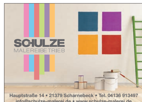
Hauptstraße 14 • 21379 Scharnebeck • Tel. 04136 913497 info@schulze-malerei.de • www.schulze-malerei.de