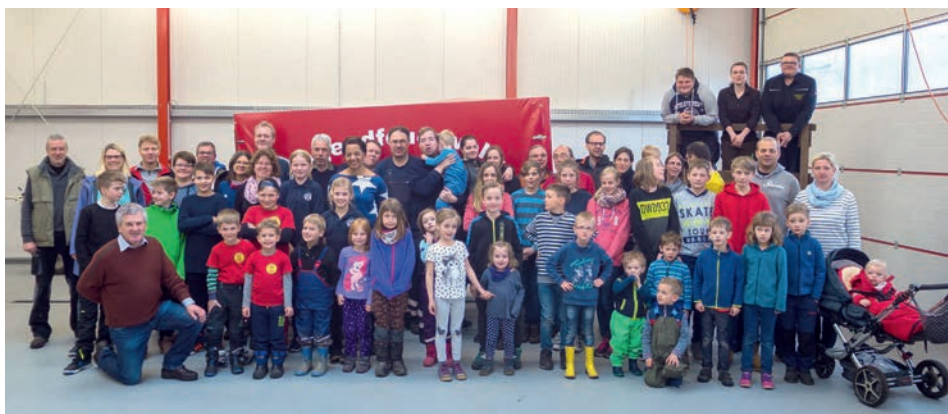
Viele fleißige Helfer von klein bis groß halfen, den Müll zu sammeln

[ Henner Sabellek ] Trotz des widrigen Wetters haben sich insgesamt ca. 80 fleißige Helfer in den drei Brietlinger Ortsteilen an der Müllsammelaktion der Gemeinde beteiligt. Bürgermeister Helmut Kowalik hatte dazu augerufen, die öffentlichen Wege und Plätze vom Müll zu befreien, bevor die Vegetation die Aktion erschwert. Aber das hat schon das Wetter geschafft. Zumindest gegen Ende der Tour gab es die Dusche von oben gratis dazu.