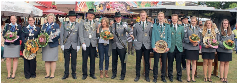
Die Majestäten des Jahres 2017

Schützen antreten lassen, um das Königs- und Preisschießen zu eröffnen. Ab 14:00 Uhr läuft auch der Festplatzbetrieb.