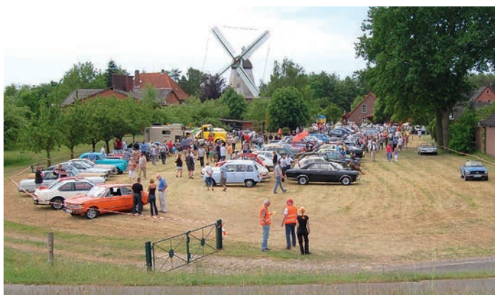
Oldtimertreffen im Schatten der Mühle

Wie in jedem Jahr finden an diesem Tag Mühlenführungen statt und sie können die