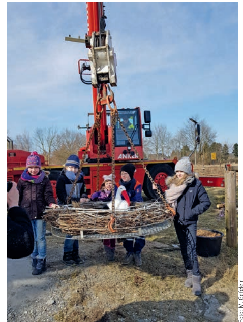
Das fertige Nest ist bereit zum Aufsetzen auf den Pfahl