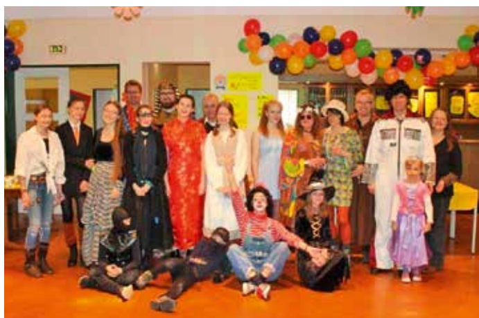
Hier einige Mamas und Papas mit der ChefIn

Auch im Jahr 2018 werden wieder Osterfeuer in unserer Gemeinde stattfinden. Schauen Sie doch einfach mal vorbei und unterstützen Sie durch Ihre Teilnahme die Feuerwehren in unserer Gemeinde. Es wird hier noch einmal ausdrücklich darauf hingewiesen, dass keine Bauabfälle und behandelte Hölzer angenommen werden. Wenn Sie Grünabfälle abgeben möchten, setzen Sie sich bitte mit den Ortsbrandmeistern in Verbindung. In Hittbergen brennt am Gründonnerstag und in Barförde