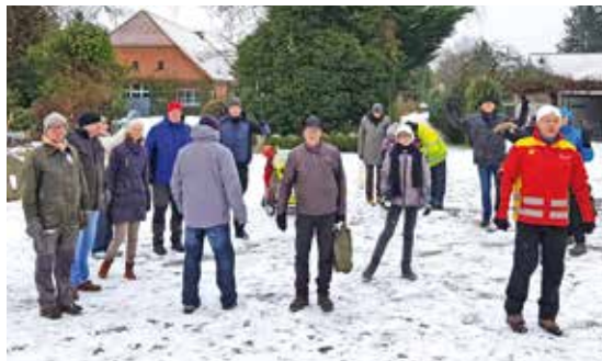
Die Boßeltour im Februar führte durch die Wiesen 15-jährigen Bestehen des Dorfgemeinschaftshauses weiter bis zum ersten Dorfflohmart

Begonnen hat es mit der Boßeltour durch die Wiesen mit anschließendem Grünkohlessen. Im April ging es mit dem Aufstellen des Maibaumes am Feuerwehrhaus und anschließender Feierlichkeit zum