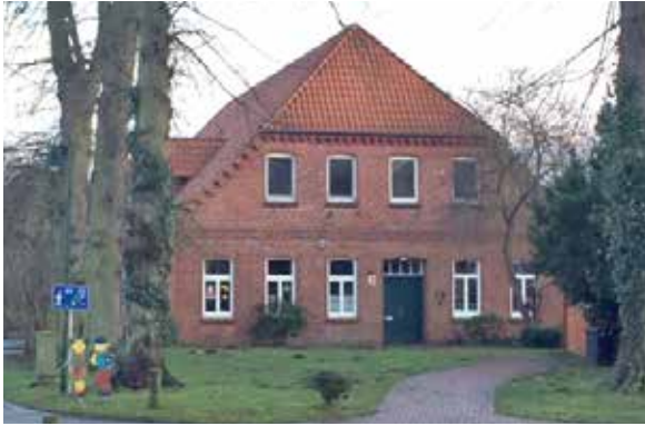
Kindergarten Peter & Paul

Die Gemeinderäte der Trägergemeinden Lüdersburg-Hittbergen-Echem haben sich einvernehmlich für den Ausbau des Kindergartens „Peter & Paul“ in Lüdersburg ausgesprochen.