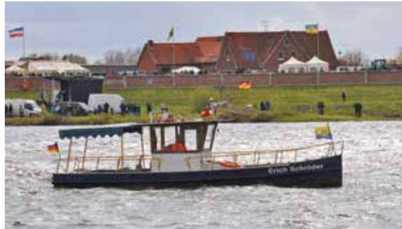
Der Kurs Elbe Tag ist immer ein Publikumsmagnet

Neben Informationen über ihre Tätigkeiten