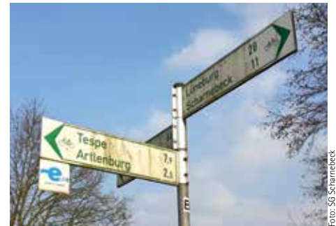
Die Schilder können eine Reinigung vertragen

Sollten Sie Interesse haben, an der Aktion mitzuwirken, melden Sie sich bitte vorher bei der Tourist-Information der Samtgemeinde Scharnebeck an. Dort erhalten Sie in Kürze auch nähere Informationen darüber.