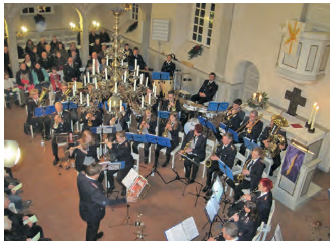
Das Adventskonzert des Musikzugs der FF Artlenburg in der St. Nicolai-Kirche ist immer ein besonderes Ereignis

Ich möchte mich im Namen des Flecken Artlenburg bei allen bedanken, die am Objekt beteiligt waren, denn es ist wichtig, dass unsere Feuerwehren erhalten bleiben und ausreichend mit Gebäuden und Gerät ausgerüstet sind. Vom Flecken Artlenburg haben wir u. a. das beleuchtete Feuerwehremblem als Geschenk dazu gegeben. Ich freue mich, auf die Anzahl der Feuerwehrkameradinnen und -Kameraden einschl. Musikzug, denn auf Sie ist stets Verlass. Alles Gute im neuen Feuerwehrhaus Artlenburg.