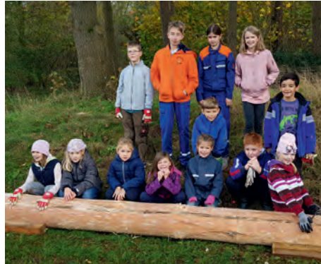
Mit Freude und Eifer waren die Kinder bei der Arbeit