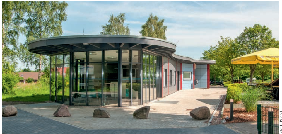
Die neue Tourist-Information in der Adendorfer Straße hat am 1. Juli den Betrieb aufgenommen

Dazu zählen nicht nur umfassende Auskünfte über die Sehenswürdigkeiten und Frei-