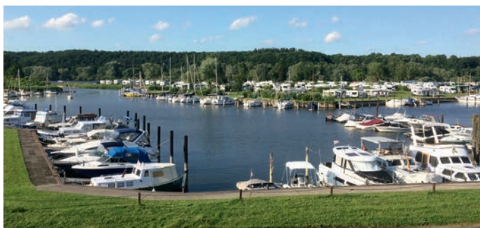
Der Artlenburger Hafen ist gut ausgebucht