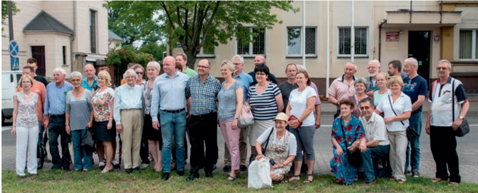
Die Treffen mit den Freunden aus Wagrowiec sind immer besondere Erlebnisse

[ Henner Sabellek ] Liebe Brietlingerinnen und Brietlinger, die Gemeinde Brietlingen unterhält seit fünf Jahren eine freundschaftliche Beziehung zur polnischen Gemeinde Wagrowiec. Die Landgemeinde Wagrowiec mit ca. 12.000 Einwohnern besteht aus vielen kleinen Ortschaften und liegt etwa 40 km nördlich von Posen. Seit 2012 finden jährliche Treffen statt, abwechselnd in Wagrowiec und Brietlingen.