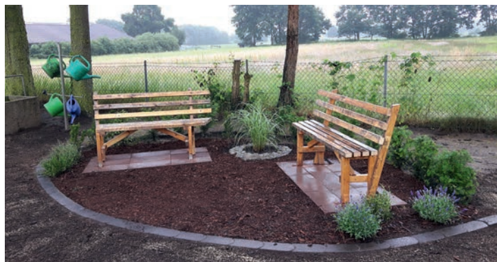
Die neue Sitzzecke lädt Friedhofsbesucher zum Verweilen ein

ter den Bänken im Halbkreis eine Eibenhecke gepflanzt. Diese soll als Sichtschutz dienen,