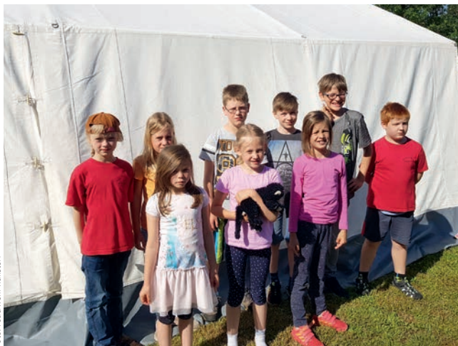
Die Kinder hatten großen Spaß beim Zelten