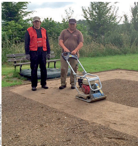
Die Lüdersburger Boulebahn erstrahlt in neuem Glanz

Über die Wintermonate ist die Boulebahn in Lüdersburg für ein schönes Boule in einen