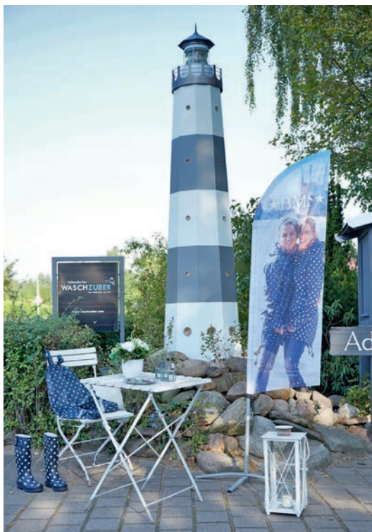
Der Leuchtturm ist das Markenzeichen des Adendorfer Waschzubers

Mit seiner dunkelgrauen Holzfassade erinnert der „Adendorfer Waschzuber“ in der Dorfstraße 57 an einen skandinavischen Kaufmannsladen, der auf 200 m 2 Verkaufsfläche für jeden etwas zu bieten hat. Der große grau-weiß gestreifte Leuchtturm signalisiert „Hier gibt es etwas Besonderes!“ In dem gemütlichen Blockhaus ist Stöbern ausdrücklich erlaubt. Hier kann man entdecken und finden: Feinste Trüffel-Pralinen und ausgesuchte Teesorten sowie hoch-