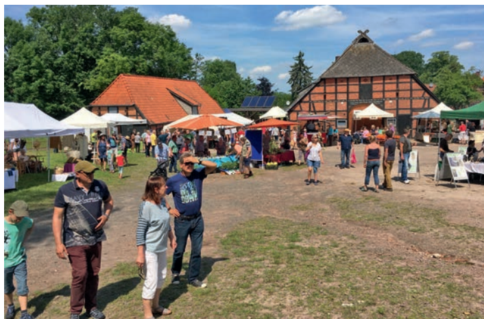
Die Besucher strömten in Scharen zum Archetag nach Rullstorf

Bereits zur Eröffnung um 10:00 Uhr strömten zahlreiche Besucher bei strahlendem Sonnenschein auf den Hof in Rullstorf, wo sie ein buntes Programm erwarteten. Im Mittelpunkt standen in diesem Jahr die Kaltblutpferde, die in verschiedenen Vorführungen über den ganzen Tag ihr Können unter Beweis stellten. Hintergrund: