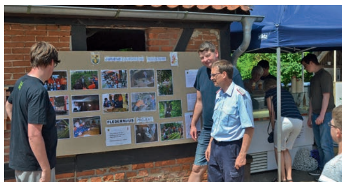
Das Fledermausprojekt der Jugendfeuerwehr Rullstorf fand auf dem Archetag großen Anklang

werden. Das Projekt hat Anklang gefunden und es konnten einige Kästen verkauft werden, um das Projekt zu finanzieren. Die Nachtwanderung des Schulbiologiezentrums haben Kinderfeuerwehr und Jugendfeuerwehr besucht. Jetzt steht noch die Sendung bei Radio ZuSa aus und die Fertigung eines Videoclips.