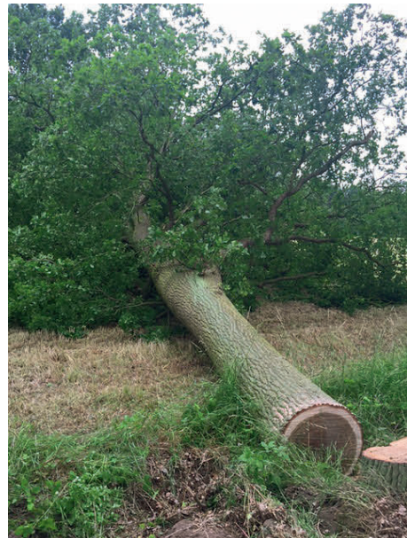
Auch stattliche Bäume hielten dem Sturm nicht stand

Von den schweren regionalen Stürmen im Juni wurde auch das Gemeindegebiet Lüdersburg heimgesucht. An vielen Stellen kam es zu Windwürfen wie im Ortsbereich Lüdersburg gegenüber der Kirche und in Jürgenstorf „Im Specken“. Die Feuerwehr musste ausrücken, um die Bäume von der Straße zu beseitigen. Wie auf dem Foto erkennbar, fielen auch mächtige, gesunde Eichen dem Sturm zum Opfer, da sie nicht standhalten konnten.