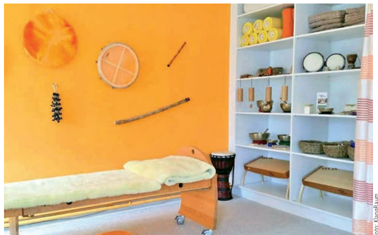
Im Klangraum steht die Freude am gemeinsamen Musizieren im Vordergrund

garten-Kursen, wo Babys und Kleinkinder mit ihren Begleitpersonen gemeinsam musizieren und spielerischen Umgang mit Klang und Rhythmus entdecken können. Die Freude am gemeinsamen Musizieren steht hier ganz im Vordergrund.