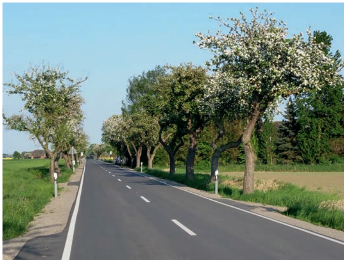
Obstblüte – Obstallee Brackede

In einer Agrarlandschaft, wo Bienen ab Mitte des Jahres zu verhungern drohen, weil sie keine Blütenpflanzen mehr finden, sind Streuobstwiesen so wichtig wie nie zuvor. Sie sind die Rückzugsräume für mehr als 5.000 Tier- und Pflanzenarten. Durch ihre extensive Bewirtschaftung und die Strukturvielfalt sind sie die