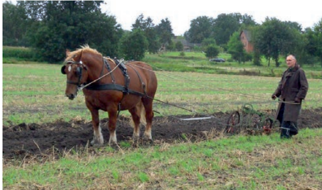
Burschi im Einsatz

[ Siegrun Hogelücht ] Der Arche-Tag ist inzwischen eine feste Institution innerhalb der Arche-Region Flusslandschaft Elbe. In diesem Jahr findet der 6. Arche-Tag am Sonntag, den 11. Juni 2017, von 10:00 bis 18:00 Uhr auf dem Hof der Familie Kühnapfel, Alte Dorfstr. 7, in Rullstorf bei Scharnebeck statt.