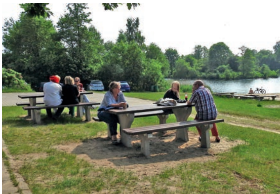
Neue Sitzgruppen und Bänke hat der Verein 2016 aufgebaut

lichen Bänke und Tische, gerade gewonnen bei dem Sparkassen-Wettbewerb „Das tut gut“, wurden nicht nur als Trialhindernisse für Mountainbikes benutzt, sondern auch mit Kohle angeschmolzen. Schmutz und Scherben gehören zum Alltag, aber diese teure Sachbeschädigung wurde zur Anzeige gebracht.