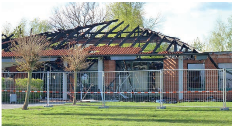
Die Grundschule Echem ist komplett ausgebrannt, es entstand ein Millionenschaden

Ich wünsche allen Bürgerinnen und Bürgern auch im Namen des Gemeinderates noch ein-