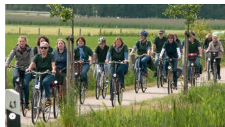
2016 nahmen 850 Radler an der Tour de Marsch teil

Die Verlosung der zahlreichen Tombolapreise beginnt ab 15:00 Uhr. Als 1. Preis winkt wieder ein Fahrrad von „Anne's Fahrradladen“ aus Echem. Bis dahin warten wieder die leckeren Torten der Schützendamen und Gebrilltes von