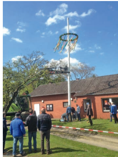
Der Maibaum steht am Feuerwehrhaus

[ Franz Darger ] Der Bürgerverein Rullstorf e.V. lud am 30. April zum 1. Maibaumaufstellen am Dorfgemeinschaftshaus bzw. Feuerwehrhaus ein, um eine neue Tradition zu begründen. Bei strahlendem Sonnenschein fanden sich 120 Bürgerinnen und Bürger am Maibaum ein.