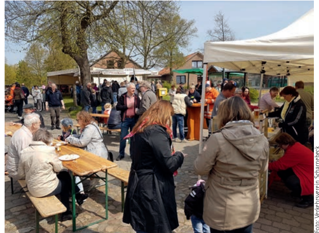
Das Maifest in Hittbergen zog Besucher von nah und fern an