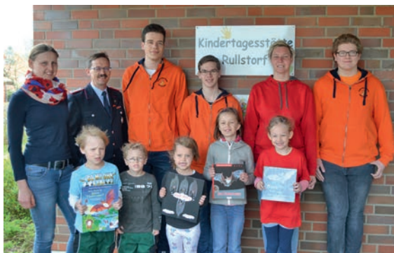
Die Kinder der Kita und der Feuerwehr bauen gemeinsam Fledermauskästen

Die Jugendfeuer bereitet das Projekt auf, indem ein Film gedreht, ein Plakat der beteiligten Kinder gefertigt und eine Landkarte der Standorte der aufgehängten Fledermauskästen erstellt wird. Mit dem Projekt wird sich die