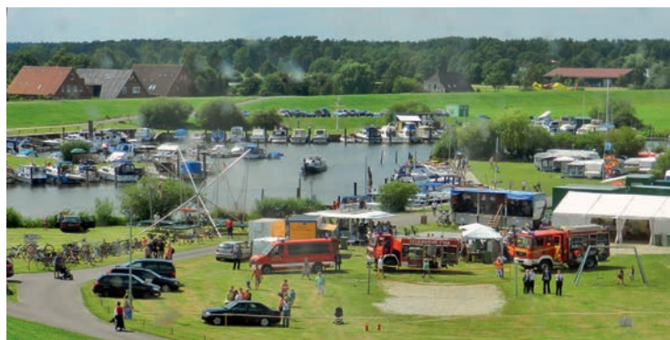
Das Artlenburger Hafenfest bietet eine Vielzahl von Attraktionen

Am Pfungstmontag, 5. Juni 2017, findet der traditionelle Deutsche Mühlen-Tag statt. Der Windmühlenverein hat die Mühle herausgeputzt, so dass sie von der Öffentlichkeit besichtigt werden kann. Der Kornspeicher ist neu hergerichtet worden und wird am Pfungstmontag bei Kaffee Kuchen und