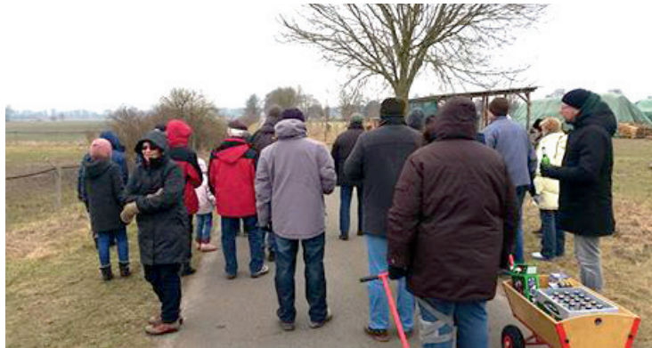
Trotz eisiger Temperaturen hatten die Rullstorfer Spaß beim Boßeln

Das neue Jahr startete dann auch gleich mit einer Boßeltour im Februar. 22 Teilnehmer machten sich mit zwei beladenden Bollerwagen auf den Weg durch die Wiesen