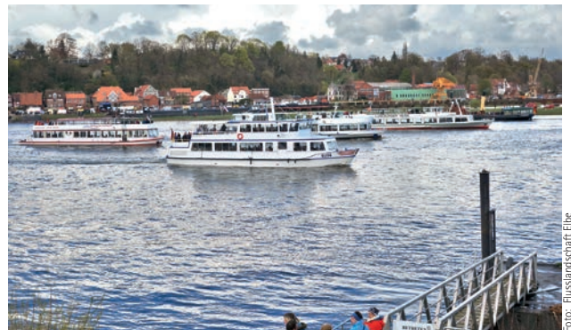
Die Fahrgastschiffahrt der Elbe zwischen Hamburg und Wittenberge feiert ihre Saisonöffnung am 23. April 2017 mit dem Kurs Elbe. Tag

sucher auch alle Angebote auf beiden Seiten der Elbe wahrnehmen kann, gibt es ein Schiffs pendelverkehr zwischen Hohnstorf und Lauenburg. Erwartet werden wieder um die 10.000 Besucher. Der Besuch des Kurs Elbe. Tages ist kostenfrei. Gegen eine Gebühr stehen der Schiffs pendelverkehr, die Schiffsrundfahrten sowie die Mitfahrt beim Schiffskorso allen Besuchern zur Verfügung.