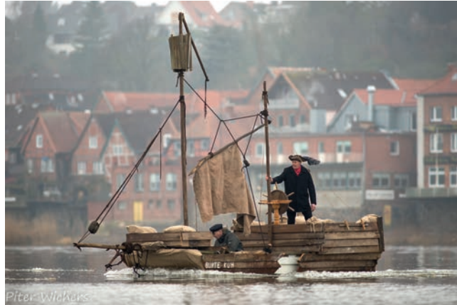
Die selbstgebaute Hansekogge war ein echter Hingucker

sich die Verantwortlichen beim TuS und fingen an, sich für Outdoor-Sportgeräte zu begeistern. Die Gemeinde gibt 10.000 Euro dazu und auch die 1.000 Euro aus dem Spendenzylinder der Eiswette fließen in die Volksgesundheit.