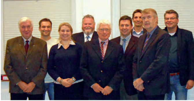
Der neue Lüdersburger Rat

22:00 Uhr statt. Sie können sich von festlich geschmückten Weihnachtsständen und einem weihnachtlichen Musikprogramm verzaubern lassen. Ein Weihnachtsbaum kann auch gleich gekauft werden. An den Weihnachtsständen