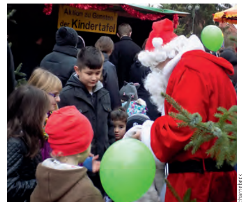
Der Besuch des Weihnachtsmanns ist der Höhepunkt des Weihnachtsmarkts für die Kinder

Das Gastronomieangebot reicht über heißen Kakao über Glühwein bis zum Beerenwein, von der Bratwurst über die