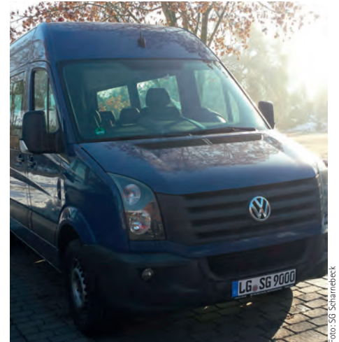
Der Scharnebecker „Dörferbus“ startet ab Januar 2017

spätestens jedoch für montags immer donnerstags vorher und für mittwochs den Montag vorher. Außerdem wird es einmal im Monat, immer donnerstags, eine „Ämterfahrt“ zwischen 8:00 und 18:00 Uhr über die Mitgliedsgemeinden zum Rathaus nach Scharnebeck geben.