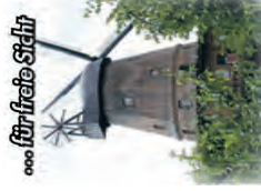
für die Stadt