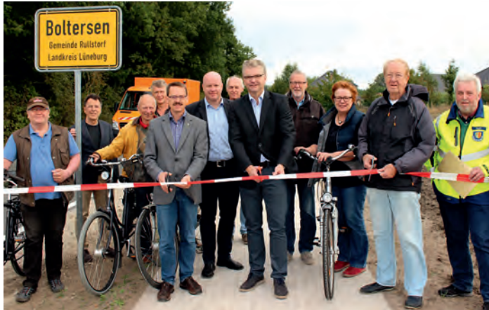
Freigabe des Radwegs von Boltersen nach Sülbeck

Im Dezember wird in gewohnter Manier wieder die Adventsfeier für die Senioren stattfinden. Ich hoffe auf eine große Beteiligung.