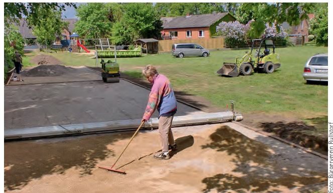
Die Boulebahn konnte Ende Juli eingeweiht werden