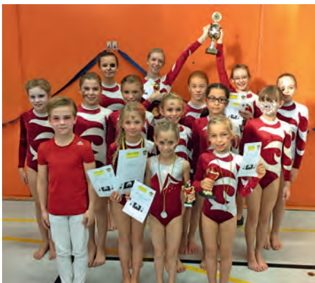
Der Wanderpokal ging mit nach Scharnebeck

[ Andrea Paepke ] Die SVS Leistungsturnerinnen turnten erfolgreich beim alljährlichen Halloweenpokal in Hamburg. Es war der einzige Verein aus dem Turnkreis Lüneburg, der dort gestartet ist. Die Kinder und Kampfrichter waren wieder toll verkleidet und geschminkt.