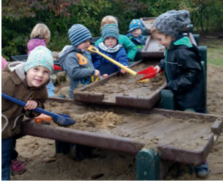
Die neuen Matschtische machen großen Spaß

[ Matthis Naß ] Die Kinder der Kindertagesstätte Rullstorf sind mit großer Begeisterung in ihrer Matscheküche tätig. Diese wurde durch neue Matschtische erweitert.