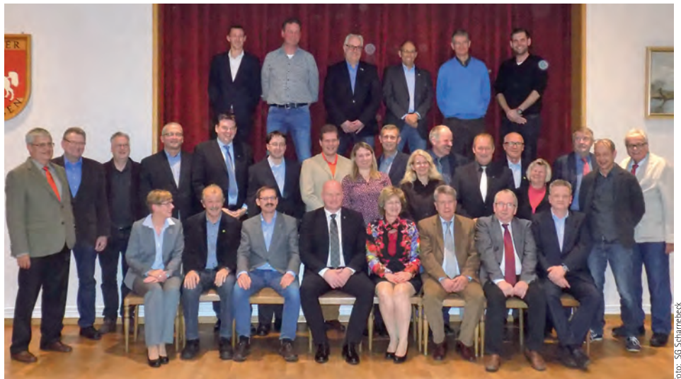
November 2016: Der neue Samtgemeinderat

Anzahl der Ausschussmitglieder bestimmt worden. Die Anzahl der Ausschussmitglieder wurde auf sieben festgelegt.