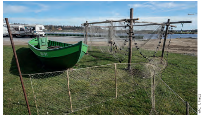
Außengelände des Fischereimuseums