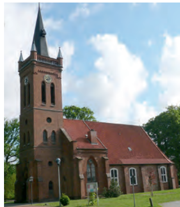
Lüdersburger Peter und Paul Kirche

Neues/Aktuelles sowie die weiteren Kontaktdaten finden Sie auf der Homepage der Gemeinde unter www.gemeinde-luedersburg.de Ihr Bürgermeister Klaus Bockelmann