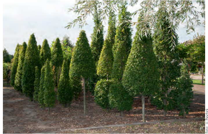
Attraktive Formgehölze warten darauf, zum Blickfang Ihres Gartens zu werden

Bei Darger in Rullstorf können Sie den Pflanzenkauf zu einem Familienerlebnis machen. So einfach geht's: Formular ausfüllen und bei