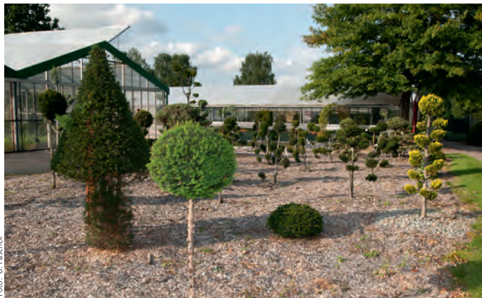
Eine große Auswahl unterschiedlicher Gehölze wird in Rullstorf präsentiert

schönem Herbstwetter einen Baum aussuchen, der dann mit Ihrem persönlichen Verkaufsschild gekennzeichnet wird. Je nach Wetterlage werden Ende Oktober die Rodung und Transportvorbereitung durchgeführt. Sie können wählen, ob Sie Ihren Baum selbst