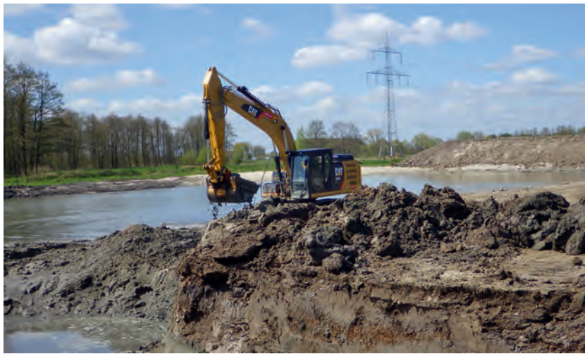
Bagger förderten den für den Deichbau wichtigen Klei an die Oberfläche