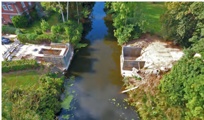
Die Brückenbauarbeiten gehen zügig voran