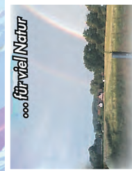
für viel Natur

ECHM, Am Osterwinkel: 11 Grundstücke, 650 - 1100 m 2