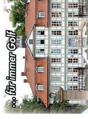
für immer Golf

HITBERGEN, Im Kamp: 2 Grundstücke für EFH