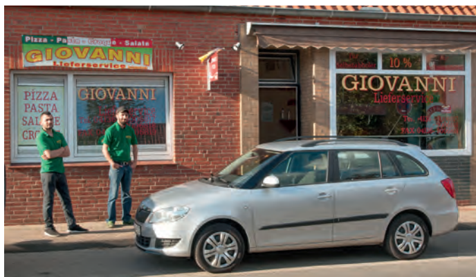
Giovanni Lieferservice in der Hauptstraße in Scharnebeck

[ Ulrich Paschek ] Freitag Abend, es klingelt an der Tür und ein leckerer Duft von heißer Pizza umschmeichelt die Nase. Sie dürfen sich auf ein frisch zubereitetes und prompt ausgeliefertes Abendessen freuen! Geliefert von Giovanni Lieferservice aus Scharnebeck, dem Spezialisten rund um Pizza, Pasta, Croque und mehr.