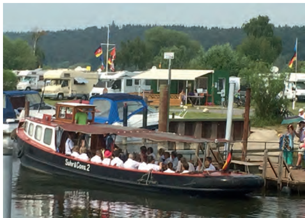
Fahrten mit der historischen Barkasse sind einer der Höhepunkte auf dem Artlenburger Hafenfest

Am Samstag spielt ab 19:00 Uhr die Liveband „Nighttime“ mit vier Musikern. Für