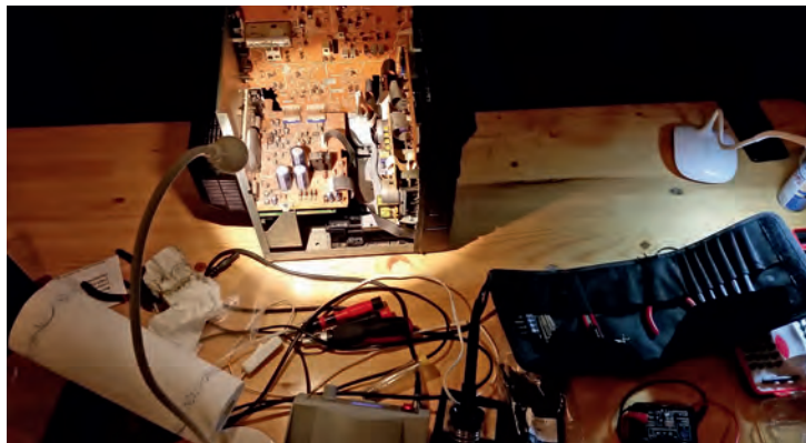
Vieles kann sofort repariert werden

RepairCafé eingebaut. Wenn nichts mehr zu machen ist, dann ist die Enttäuschung schnell überwunden: „Jetzt weiß ich zumindest Bescheid, und dann ist halt nichts mehr zu machen – schade!“ Diese Aussage entspricht genau der den RepairCafés zugrunde liegenden