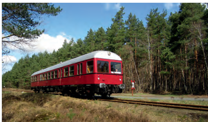
Die Landschaft einmal anders entdecken mit der Museumseisenbahn

Ab Mai startet die historische Eisenbahn auf der alten Strecke der „Bleckeder Kleinbahn“ wieder zu regelmäßigen Fahrten zwischen Lüneburg und Bleckede. Fahrgäste können an den Haltepunkten in Scharnebeck, Rullstorf oder Boltersen einsteigen. An jedem Fahrtag fährt die Eisenbahn drei Mal zwischen Lüneburg und Bleckede hin und her. Die Fahrt geht durch die typische Landschaft der Region mit ihren Wiesen, Wäldern und Feldern. In Bleckede im Biosphaerium finden Sie ein Aquarium mit heimischen Fischen, eine Biberanlage, einen Aussichtsturm und eine