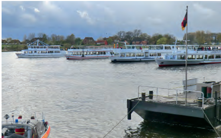
Der Schiffskorso war einer der Höhepunkte

[ Wolfgang Herbst ] Die Erwartungen vor dem Kurs Elbe. Tag am 24. April waren bei dem Organisationsteam, den Medien und den Besuchern recht hoch. Gedämpft wurden die Erwartungen jedoch durch ein winterliches Aprilwetter, das ausgerechnet an diesem Wochenende zur Hochform auflaufen musste. Dadurch ließen sich die vielen Teilnehmer die Stimmung aber nicht vermiesen. Sowohl die Shantychöre, die Schiffer, die Aussteller, das Team um das Leitprojekt Kurs Elbe. Hamburg bis Wittenberge und natürlich auch die Gäste machten deutlich, was ihnen ihr Kurs Elbe.Tag bedeutet. Rund 8.000 Besucher trotzten den teilweise winterlichen Temperaturen und wenn sich die Sonne