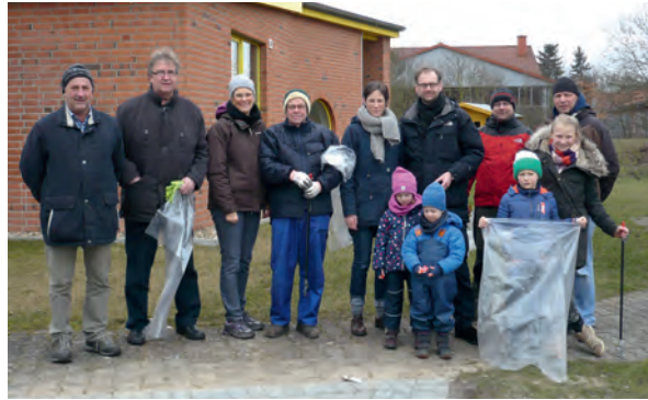
Fleißige Helfer füllten die Säcke mit allerlei Müll und Unrat

So erhalten der TUS Brietlingen knapp 14.600 € für die Unterstützung der Vereinsarbeit und diverse Investitionen sowie die DLRG-Ortsgruppe Adendorf-Scharnebeck für den Bau