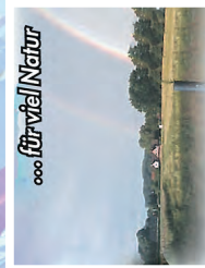
für viel Natur

ECHM, Am Osterwinkel: 20 Grundstücke, 650 - 1100 m 2