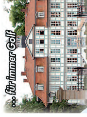
für immer Golf

JÜRGENSTORF, Im Buschbaum: 2 Grundstücke, 814 u. 915 m 2