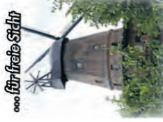
für die Natur