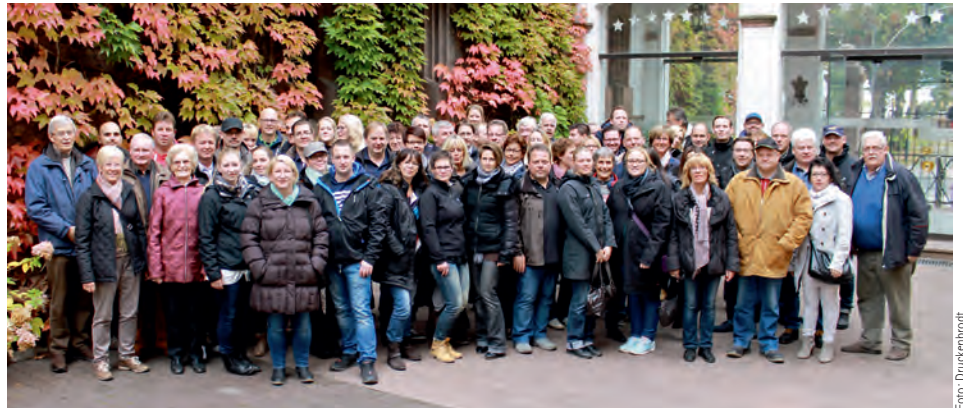
Der Schützenverein auf Tour