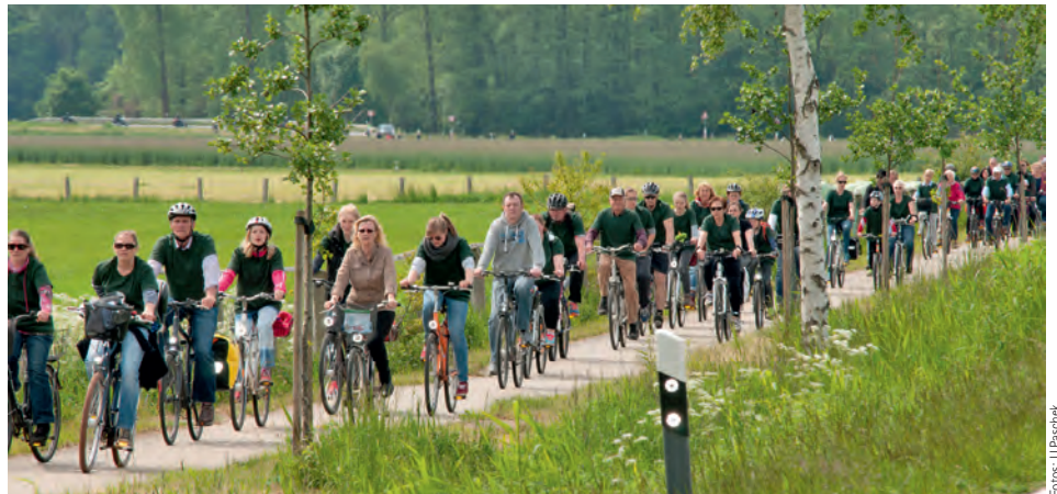
Rund 700 Fahrradbegeisterte nahmen an dem Rundkurs teil

Den Weinliebhaber erwartete in diesem Jahr eine große Auswahl an Spezialitäten und Gaumenfreuden – präsentiert von den regionalen Wirten „Kleine Kneipe“, „Gasthaus Nienau“, „Grüne Stute“, „Rusticus“, „Von Herzen“ und „Edeka Greinert“.