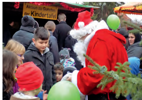
Der Nikolaus zu Besuch auf dem Weihnachtsmarkt

keiten vom Grill, aus der Pfanne oder aus der Räucherei, sondern auch Leckereien zum Naschen wie Kekse, Waffeln oder dem leckeren Kuchen der Schützendamen. Auch wenn die Temperaturen in den letzten Wochen eher auf