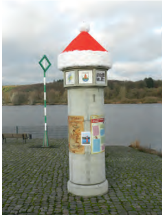
Weihnachtlicher Gruß für die Schifffahrt

Von großen Wetterkapriolen blieben wir 2015 glücklicherweise verschont, so dass die Hafen- und Campingsaison mit erneutem Zuwachs abgeschlossen werden konnte. Für den Bebauungsplan „Neubau Feuerwehr Artlenburg“ wurde die 1. Änderung des Bebauungsplanes Nahversorgung an der B209 als Satzung beschlossen und die Baugeneh-