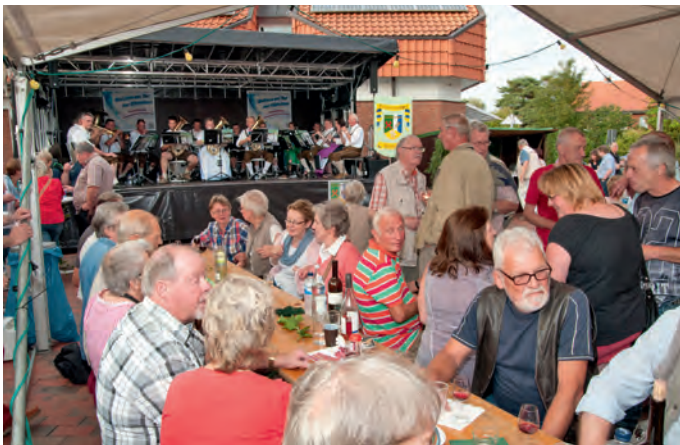
Bei guter Musik und schönem Wetter genossen alle Gäste das Weinfest