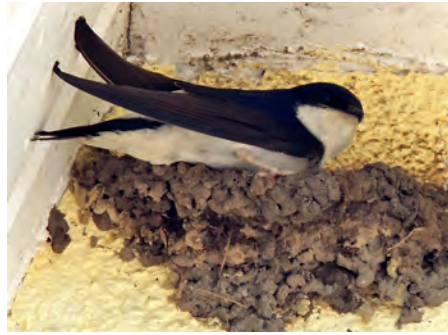
Schwalbennest am Insee

Erstmals in diesem Jahr hat die Gemeinde Scharnebeck ihre gefiederten Gäste bei der