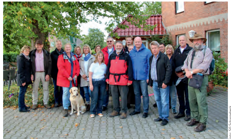
Die Wandergruppe erkundete das Urstromtal