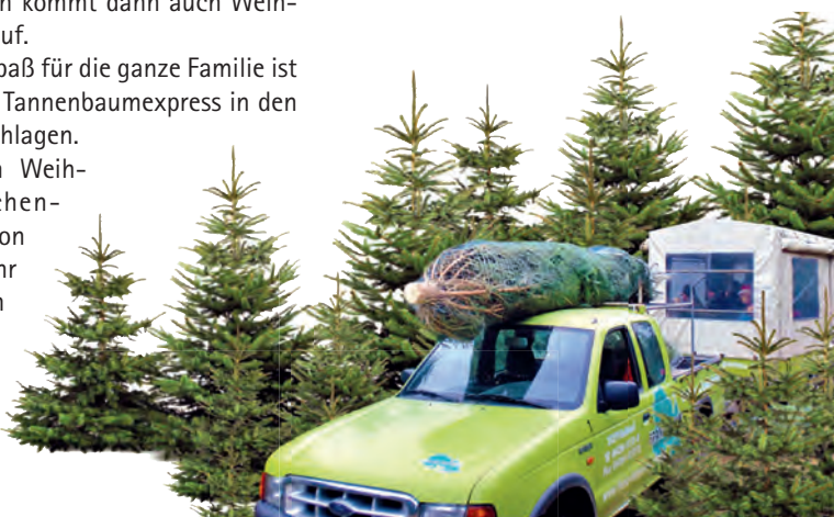
Mit dem Tannenbaumexpress geht gut versorgt zum Baumschlagen

nenbäume werden bis zum 24. Dezember um 12:00 Uhr verkauft!