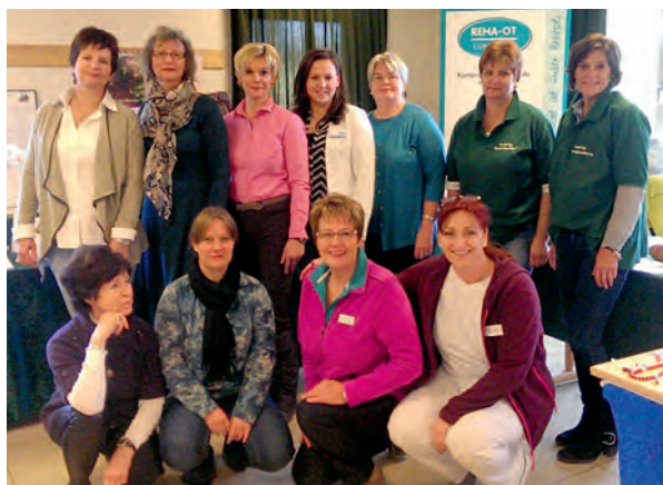
Die Aussteller am „Tag der Gesundheit“ der LandFrauen Brietlingen