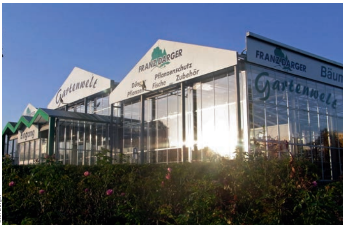
Die Darger-Gartenwelt bietet eine riesige Auswahl

Da auch Weihnachtsbäume/Nordmannentannen in der Baumschule kultiviert werden, gibt es seit vielen Jahren am 3. Adventswochenende ein Tannenbaumevent mit Weihnachtsmarkt. Für kleine Gruppen und Firmen bis zu 100 Personen wird auch ein zünftiges Tannenbaumschlagen mit Verpflegung organisiert.