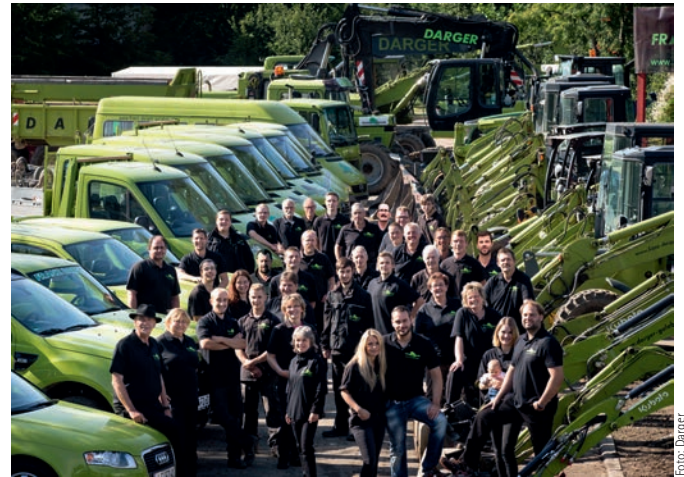
Das Team der Firma Darger