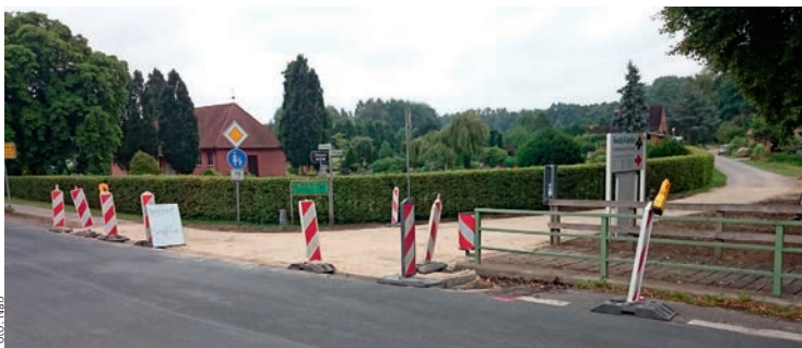
Die Einfahrt zum Schulweg wurde erneuert

Es wurden in diesem Jahre diverse größere Baumaßnahmen durchgeführt. So wurde im Schulweg im Seitenraum ein Ablauf gesetzt,