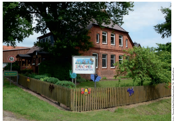
Der Sprachheilkindergarten in Neu Jürgenstorf