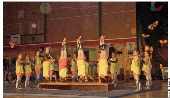
Beeindruckende Darbietungen bei der Leistungsturngruppe

NEU bei der SVS: Kraft Gymnastik - Workout-Training für jedermann und Muskelaufbautraining. Bei der Kraftgymnastik handelt es sich zwar um ein Muskelaufbautraining, im Gegensatz zum Bodybuilding wird das Augenmerk