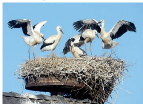
Die Jungstörche werden flügge

In diesem Jahr hat das Artlenburger Storchepaar fünf Jungstörche großgezogen. Eine Sensation, denn es gibt laut Auskunft von Herrn Horn, dem Storchenvater des Landkreises Lüneburg, im Landkreis nicht einmal ein Nest mit vier Jungstörchen. Im Schnitt der letz-