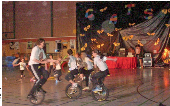
Akrobatik präsentiert von der Einradgruppe

31.10. Halloweenpokal Hamburg. 14.11., 8:30 Uhr Pokalwettkampf Turnen in Bleckede. 21.11. Gerätturn-Wettkampf der Turngemeinschaft in Gehrden. 28.11. Adventpokal Uelzen. Scharnebecker Bewegungstag Mitmachen ist ausdrücklich erwünscht, ganz Scharnebeck und Umgebung soll in Bewegung sein. So lautet das Ziel des 1. Scharnebecker Bewegungstages, der am Sonntag, 8. November (14-18 Uhr) in der großen Sporthalle des Schulzentrums Scharnebeck stattfindet. Jeder (vor allem auch Nicht-Vereinsmitglieder) kann teilnehmen, Spiel und Spaß stehen im Vordergrund. Bei verschiedenen Workshops gilt es, Geschick und Fitness zu testen. Die Turnabteilung lädt dazu herzlich ein, die Übungs- und Kursleiter stehen mit Tipps und Tricks bereit und beantworten alle Fragen.