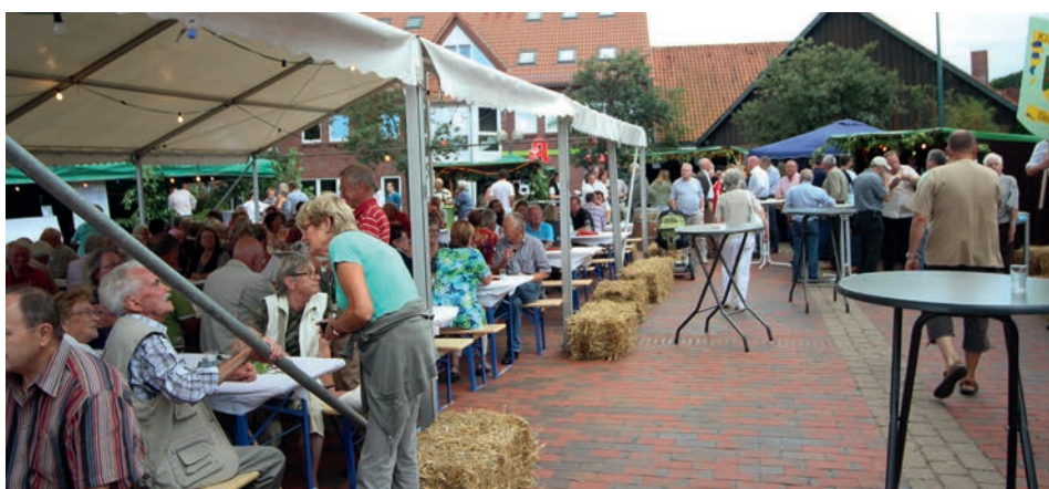
Die Besucher erwartet ein großes Angebot an edlen Tropfen und kulinarischen Leckereien