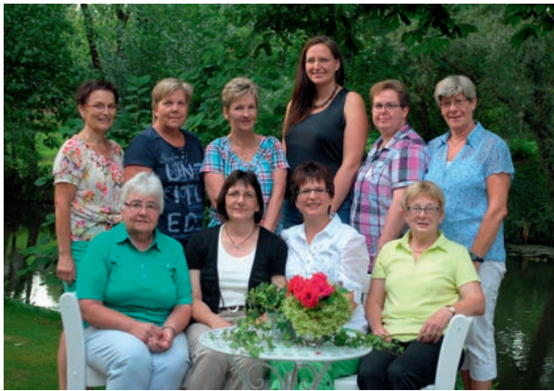
Der Vorstand des LandFrauenvereins Brietlingen/Lüdershausen

Es gibt ganz unterschiedliche Ansatzmöglichkeiten, Antworten auf diese Fragen zu finden und unser Wohlbefinden zu steigern. Einige sind Ihnen vielleicht noch gar nicht bekannt. In Kurzreferaten stellen Therapeuten aus unserer Region ihre Arbeit vor und stehen auch für persönliche Gespräche bereit.