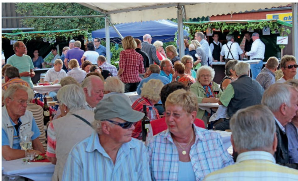
Der ganze Marktplatz eine Weinlaube: Beim letzten Weinfest waren die Tische immer voll belegt